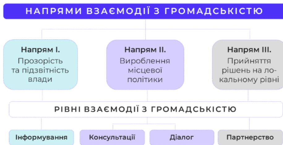
Рис. 1. Напрями взаємодії з громадськістю [14]

Результати дослідження групуються за трьома напрямками [14] з урахуванням чотирьох рівнів взаємодії між владою та громадськістю (рис. 1).