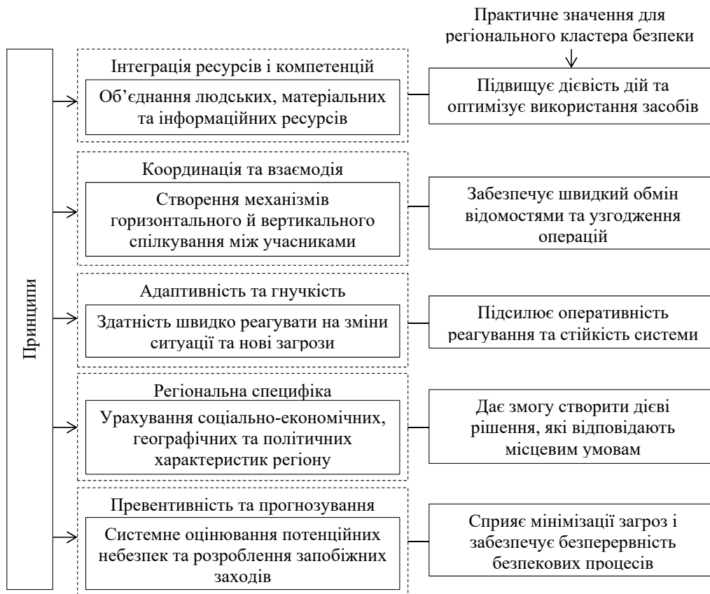
Рис. 1. Ключові принципи формування регіональних кластерів безпеки