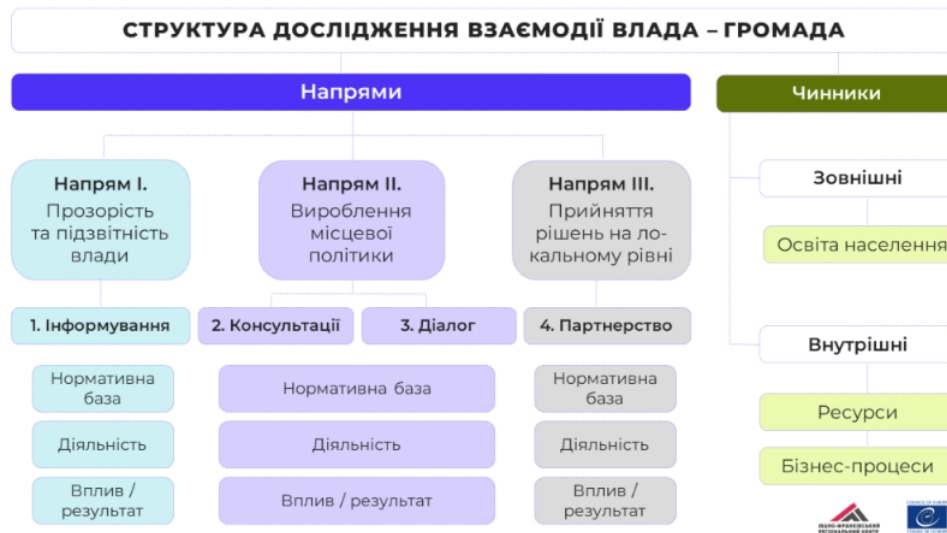
Рис. 2. Структура дослідження взаємодії влада – громада [14]

Залучення зовнішніх зацікавлених сторін, зокрема громадських організацій, експертного середовища й активних громадян, забезпечує доступ посадових осіб до релевантної інформації, що значно підвищує якість прийнятих рішень. Адже в умовах високої динаміки суспільних процесів, представники влади не завжди мають вузькоспеціалізовану компетенцію для вирішення всіх питань, а відкритість до співтворчості дає змогу компенсувати ці обмеження через спільну генерацію знань і рішень.