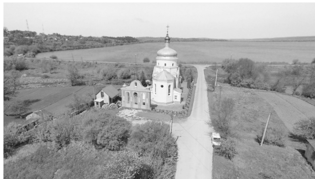
Рис. 3. Сучасний вигляд церкви св. Трійці з висоти пташиного польоту. Справа від храму – в'їзд у місто з греблі (фото В. Ільчишин, 2021 р.)