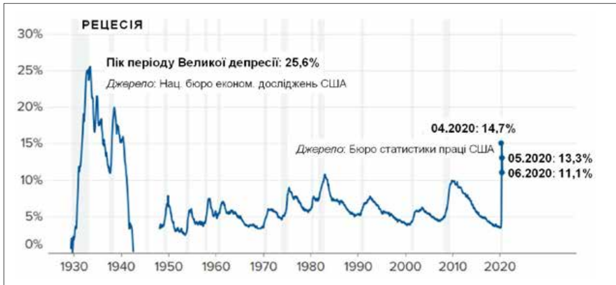
Рис. 1. Рівні безробіття в США в роки Великої депресії (1929–1942 рр.) порівняно з повосиним періодом (1948–2020 рр.), у % [5]