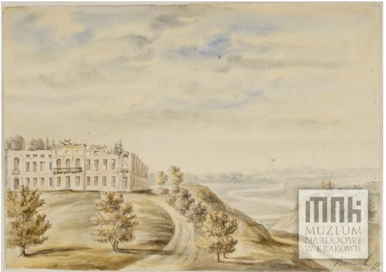
Рис. 5. Боремель. Руїни палацу Чацьких