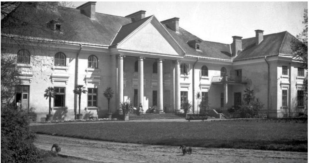
Рис. 3. Дім Чацьких