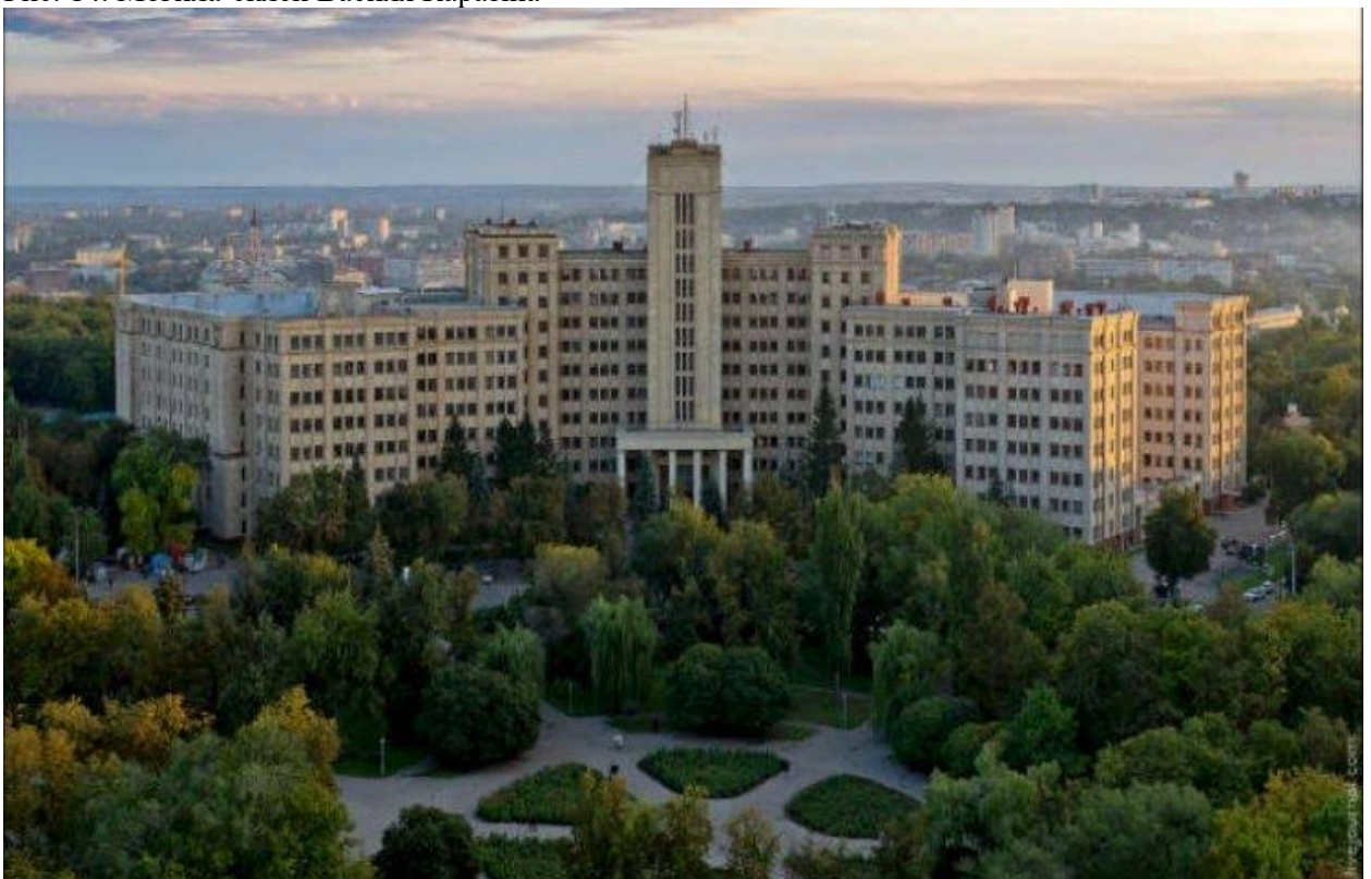
Рис. 15. Харківський університет імені Василя Каразіна