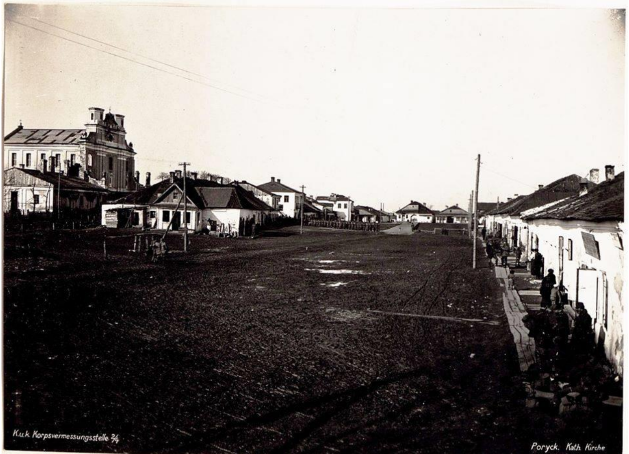
Рис. 7. Порицьк. Вулиця від палацу Чацьких