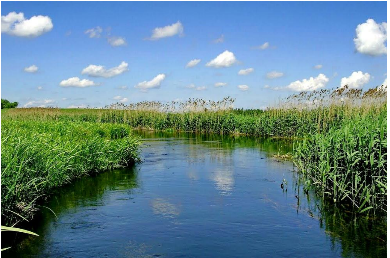
Рис. 2. р. Луга