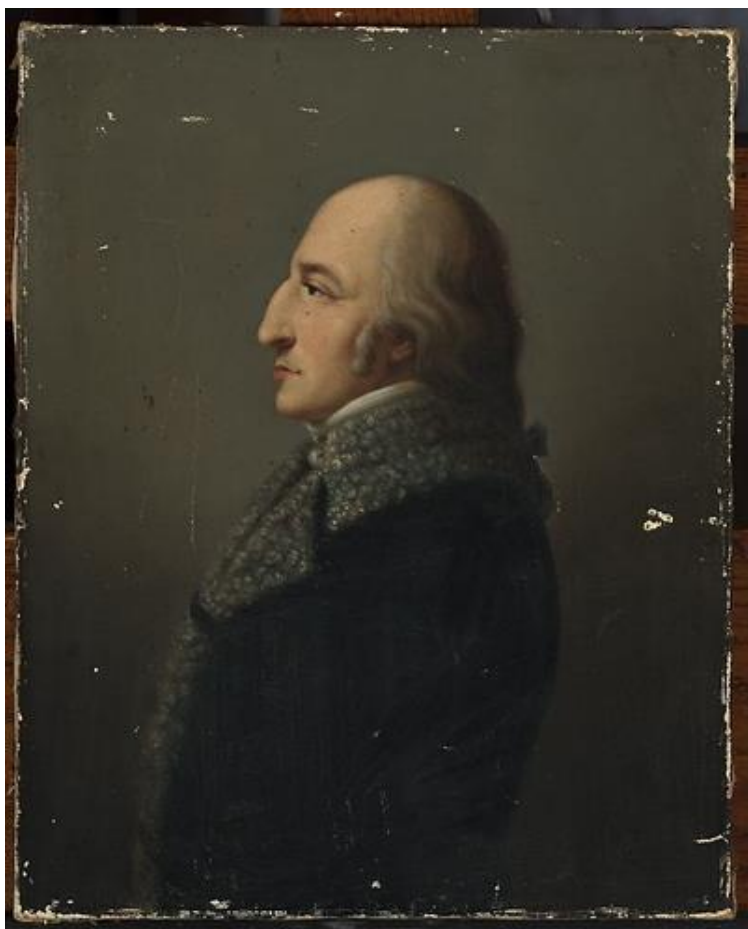
Рис. 10. Тадеуш Чацький. Варшвський музей