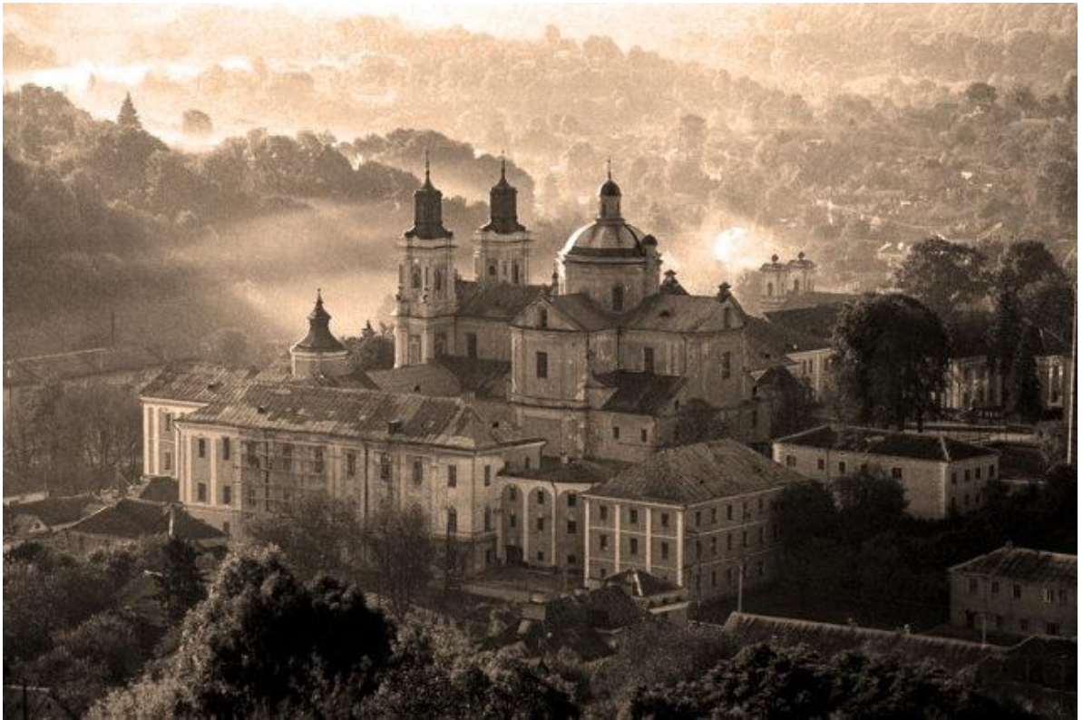
Рис. 6. Крем'янець. Крем'янецький ліцей