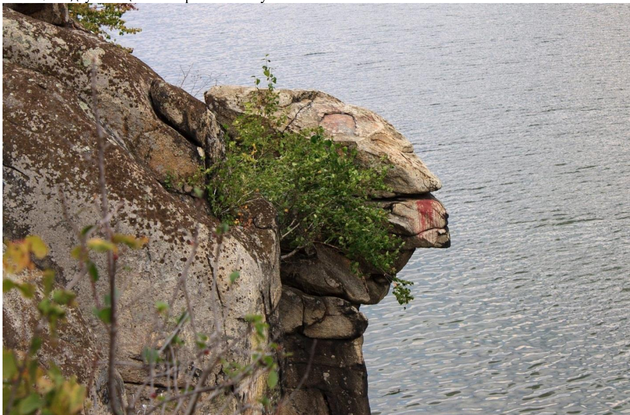
Рис. 11. Голова Чацького