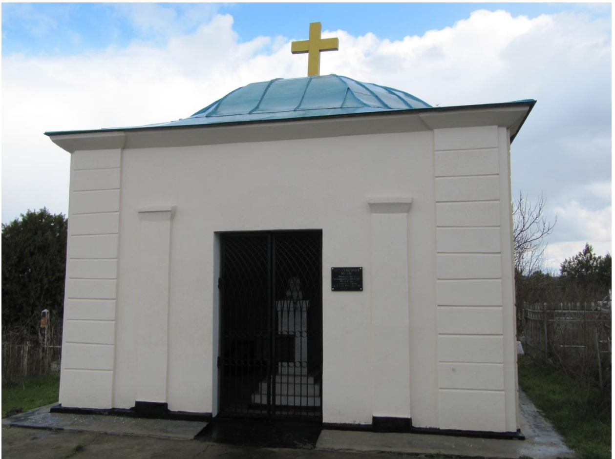
Рис. 14. Могила-склеп Василя Каразіна